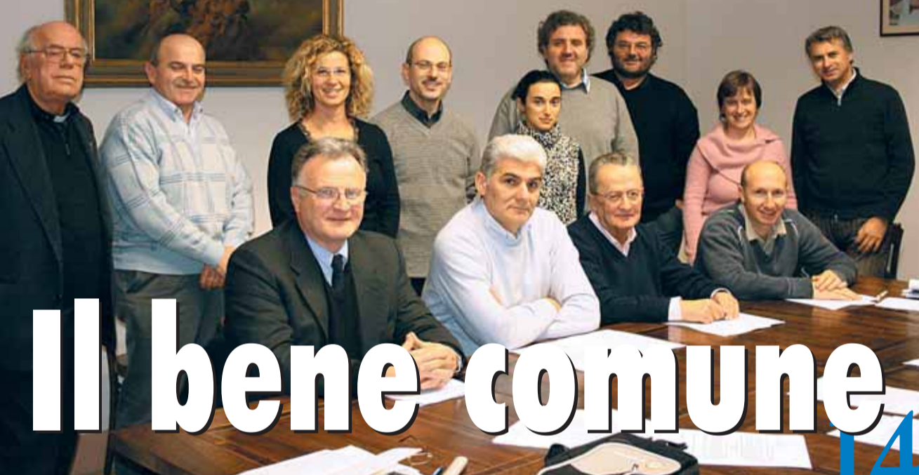
La nuova Commissione Diocesana per la Pastorale Sociale e del Lavoro