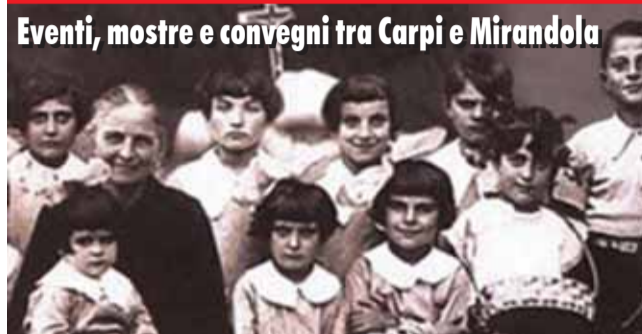
Eventi, mostre e convegni tra Carpi e Mirandola