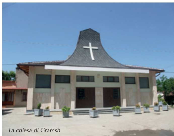
La chiesa di Gramsh

Carissimi, queste strofe di una bellissima canzone di Mercedes Sosa interpretano bene il grande cambiamento che è avvenuto nella nostra vita e che si concretizzerà alla fine di gennaio. La Congregazione delle Figlie della Carità di Torino, è in fase di cambiamento, di ristrutturazione e le forze vitali, che sono le sorelle, sono chiamate a mettersi in gioco con generosità per favorire la Vita che chiede di con-