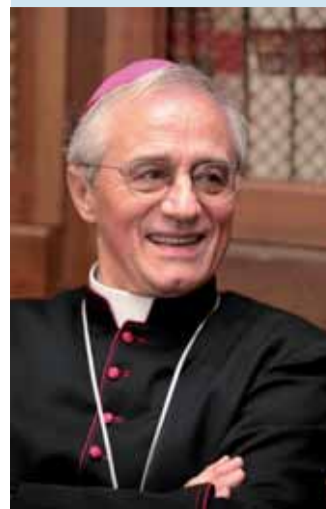
Monsignor Gianni Ambrosio , vescovo di Piacenza - Bobbio Giovedì 17 settembre ore 9,30, Seminario vescovile