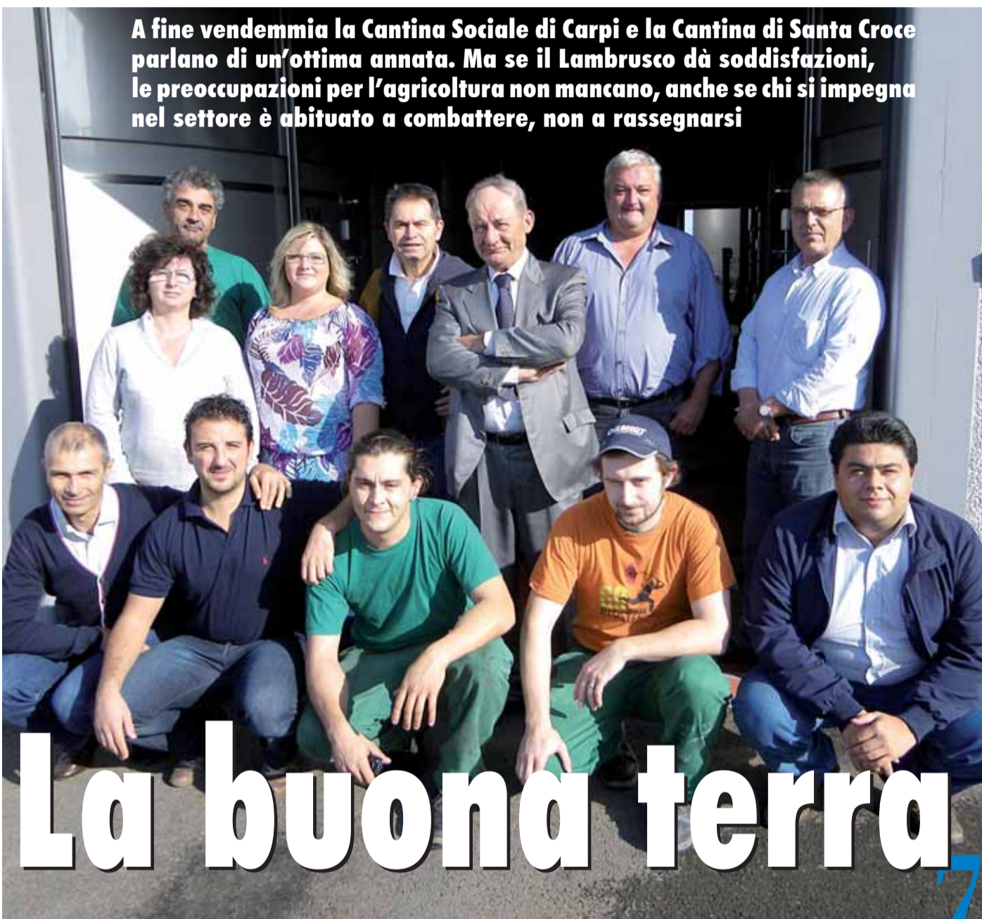
Cantina Sociale di Carpi

A fine vendemmia la Cantina Sociale di Carpi e la Cantina di Santa Croce parlano di un'ottima annata. Ma se il Lambrusco dà soddisfazioni, le preoccupazioni per l'agricoltura non mancano, anche se chi si impegna nel settore è abituato a combattere, non a rassegnarsi