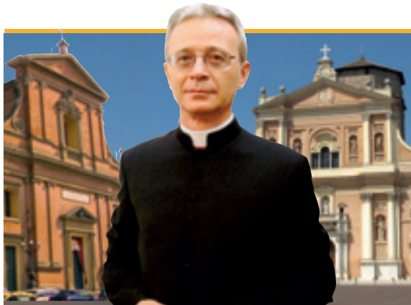
Monsignor Francesco Cavina vescovo eletto della Diocesi di Carpi