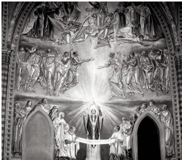
Carpi, Cappella del cimitero urbano, Sacrificio eucaristico a suffragio dei defunti , decorazione murale di R. Pelloni, 1953.