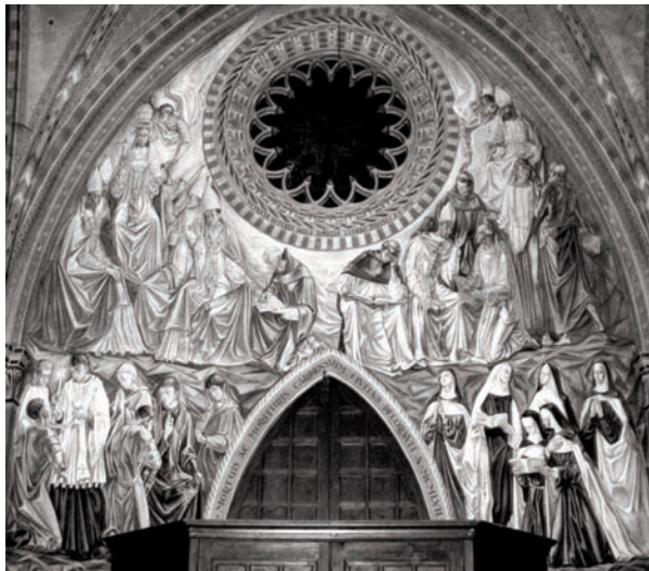
Carpi, Cappella del cimitero urbano, Chiesa pellegrinante verso il Regno , decorazione murale di R. Pelloni, 1953.