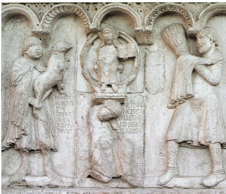
Particolare: l'offerta al Signore di Abele (a sinistra) e di Caino (a destra)

Prendo spunto da una delle lastre di Wiligelmo perché l'episodio di Caino e Abele non è pensato nella Bibbia come un resoconto storico, ma come una grande e drammatica parabola di ciò che accade sempre, fin dai tempi – noi diciamo appunto in modo quasi proverbiale “dai tempi di Caino e Abele”, cioè “da sempre” - quando l'essere umano fa prevalere l'invidia, l'orgoglio, l'affermazione di sé: questa è la scena che lo riguarda, che ci riguarda.