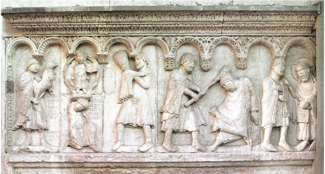
Lastra della facciata della Cattedrale - Wiligelmo – Genesi, Caino e Abele

Prendo spunto da una delle lastre di Wiligelmo perché l'episodio di Caino e Abele non è pensato nella Bibbia come un resoconto storico, ma come una grande e drammatica parabola di ciò che accade sempre, fin dai tempi – noi diciamo appunto in modo quasi proverbiale “dai tempi di Caino e Abele”, cioè “da sempre” - quando l'essere umano fa prevalere l'invidia, l'orgoglio, l'affermazione di sé: questa è la scena che lo riguarda, che ci riguarda.