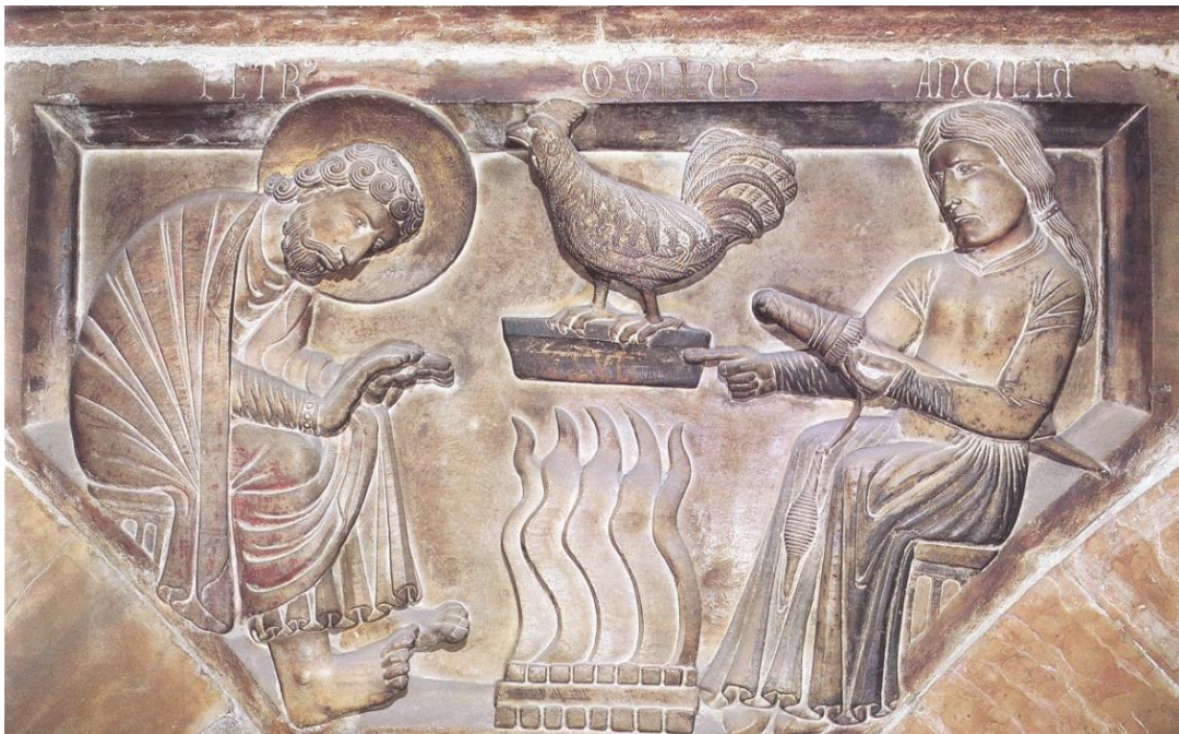
Il rinnegamento di Pietro

In parallelo, sotto, c'è la scena del rinnegamento di Pietro. Di nuovo tre personaggi: questa volta al centro non c'è un essere umano ma un gallo, che rivela la falsità di Pietro, il quale è a sinistra piegato in avanti, mentre si scalda in un gesto nel quale sembra volere nascondere la faccia per non farsi riconoscere, ma sappiamo dai Vangeli che la pronuncia lo ha tradito: hanno capito che era un galileo e che era uno dei suoi, davanti alla serva che dice: "Anche tu eri uno di loro!". E Pietro dice di no.