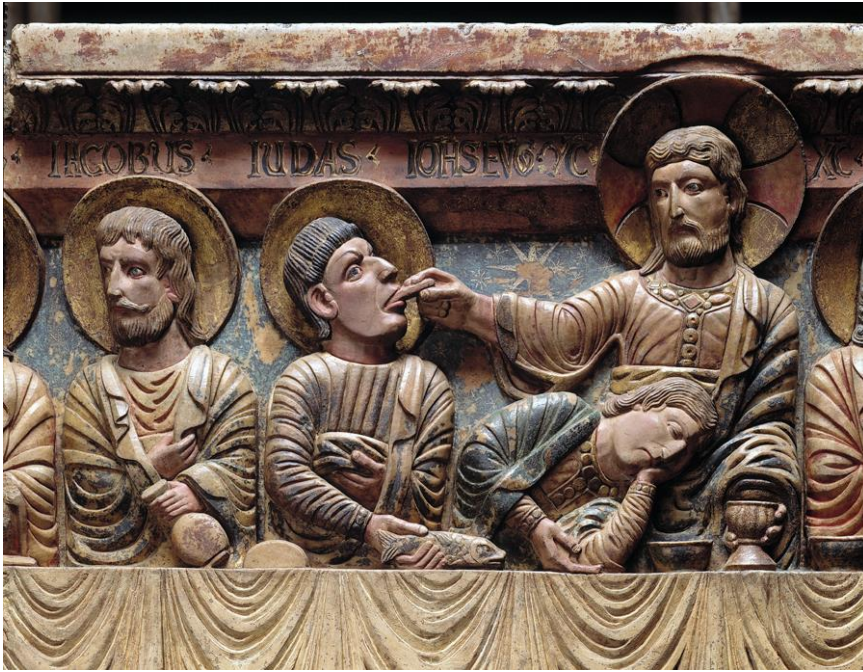
Ultima Cena: Gesù dà il pane a Giuda

E la scena della lavanda dei piedi significa che Gesù si abbassa e dà la propria vita; ha lo stesso significato sotto la forma del sacramento dell'Euca-restia e sotto la forma del servizio.