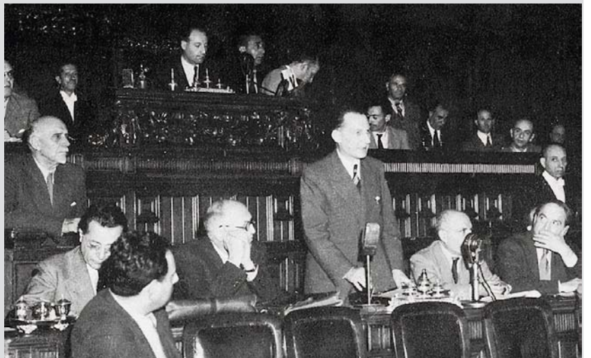
De Gasperi presenta il suo governo alla Consulta, 25 settembre 1945