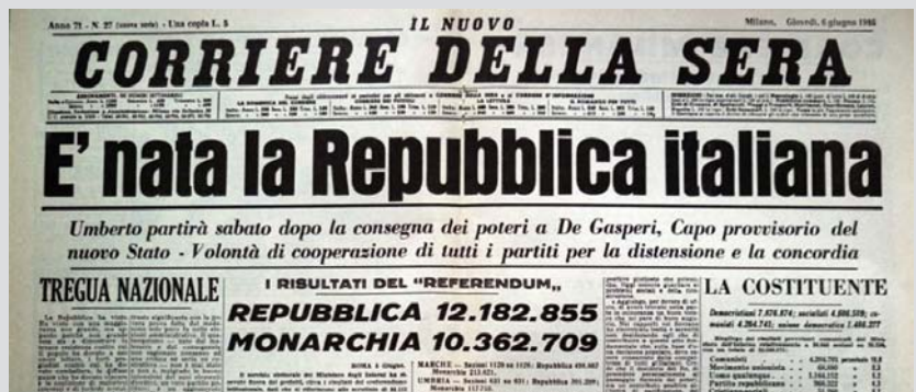
Prima pagina del Corriere della Sera, 6 giugno 1946