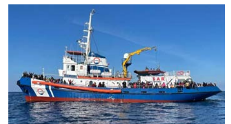
La "Mare Jonio" è un rimorchiatore ("Tug"), originariamente entrato in servizio nel 1972. Nave di monitoraggio e soccorso battente bandiera italiana nel Mediterraneo

https://mediterraneaescue.org/it https://www.instagram.com/mediterraneaescue/ https://www.facebook.com/Mediterraneaescue/