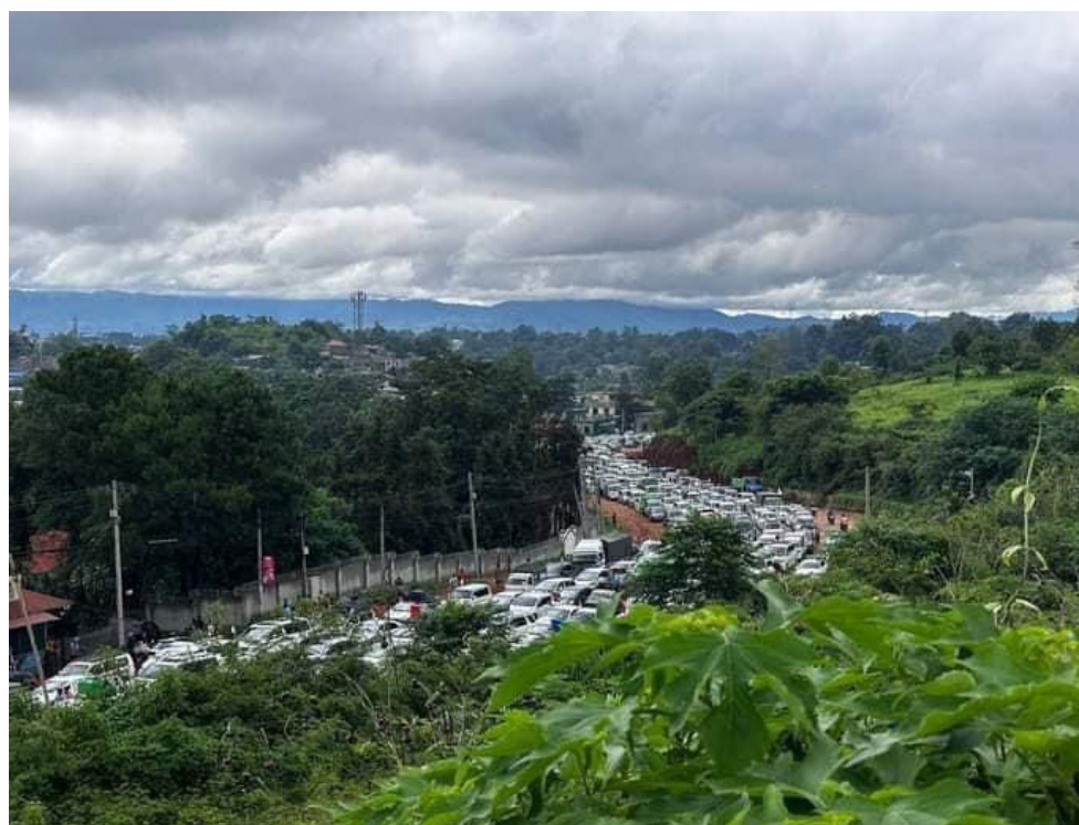
Auto in fuga verso la foresta