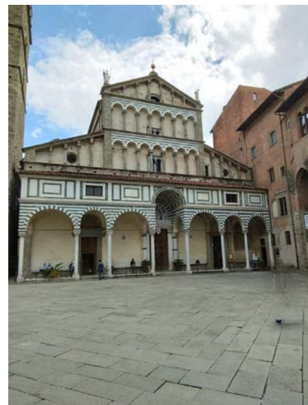
Cattedrale di San Zeno a Pistoia