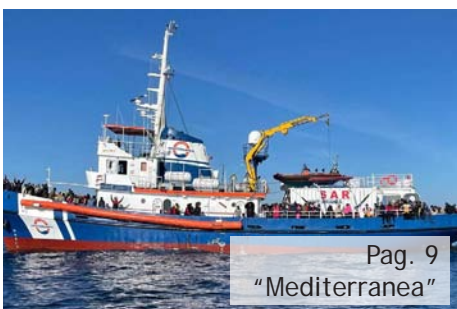
Pag. 9 "Mediterranea"