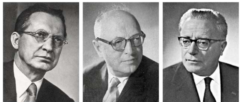
Da sinistra: Alcide De Gasperi, Pietro Nenni, Palmiro Togliatti