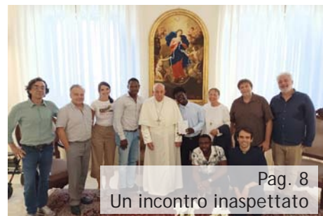
Pag. 8 Un incontro inaspettato