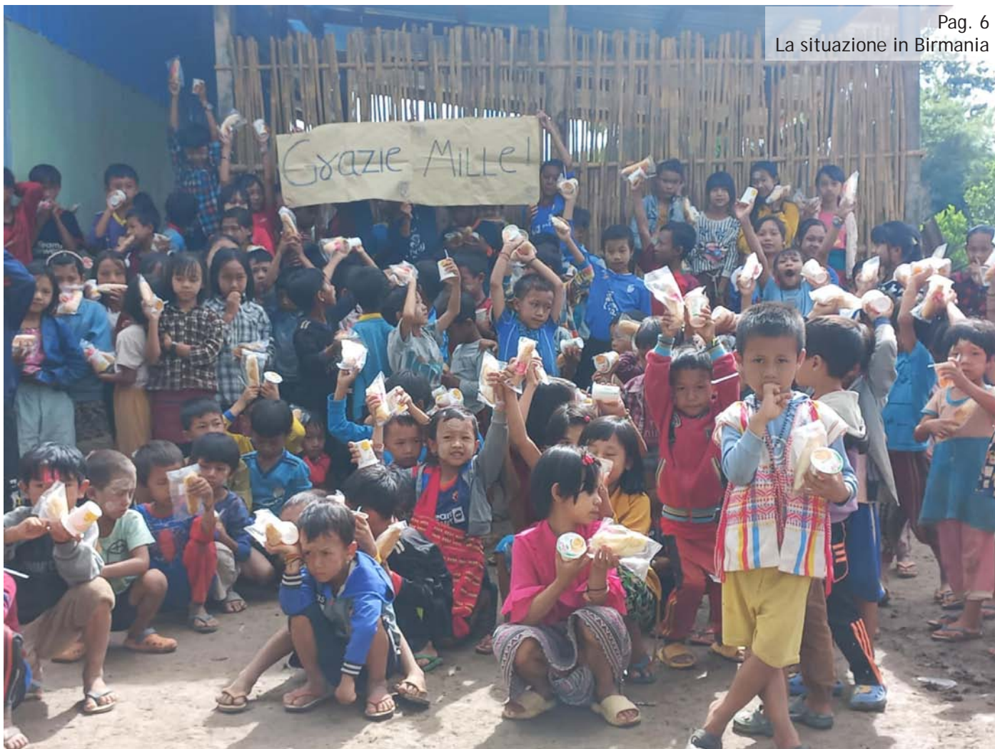
Pag. 6 La situazione in Birmania