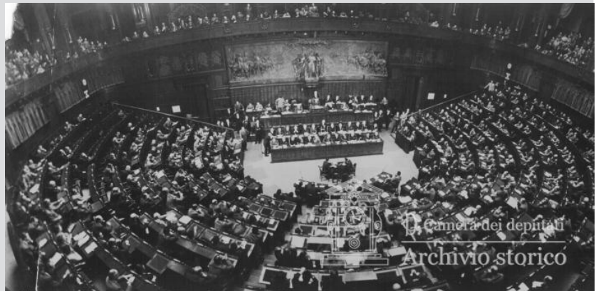
Assemblea Costituente, la prima seduta il 25 giugno 1946

Ed è utile ricordare che tra i 556 deputati che parteciparono alla Costituente c'erano nomi di spicco che avrebbero poi guidato la vita politica del paese per parecchi anni portandolo fuori dalla disperata situazione in cui si trovava nel dopoguerra: Alcide De Gasperi, Pietro Nenni, Palmiro Togliatti, Sandro Pertini, Bernardo Mattarella, padre del nostro amato presidente della Repubblica e anche 21 donne tra cui Lina Merlin, Nilde Iotti, Maria Federici, Teresa Noce in rappresentanza di tutti i partiti. Questi uomini e queste donne, avevano nel loro intimo un sentimento che oggi pare scomparso: degli ideali e oltre agli ideali delle idee chiare e di buon senso.