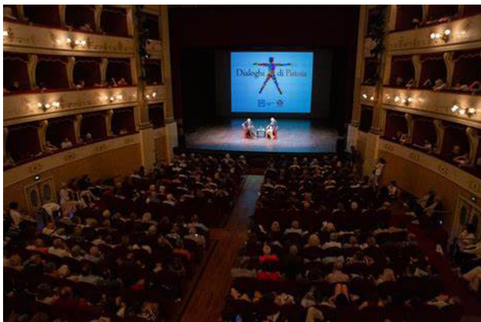
Teatro di Dialoghi di Pistoia