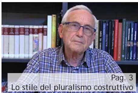
Pag. 3 Lo stile del pluralismo costruttivo