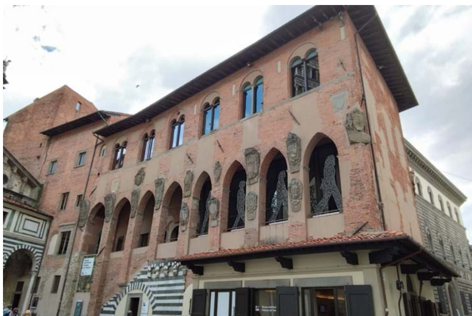
Antico Palazzo dei Vescovi di Pistoia